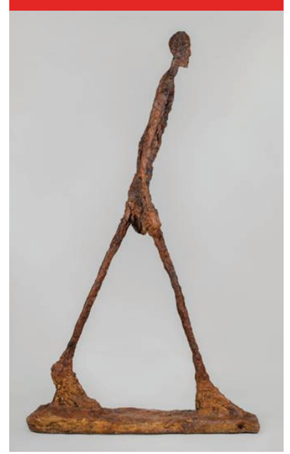
الشكل رقم 9

جياكوميتي الرجل الماشي، سنة 1960 منحوتة من الجبس الأبعاد: 149 سم × 22 سم × 33 سم