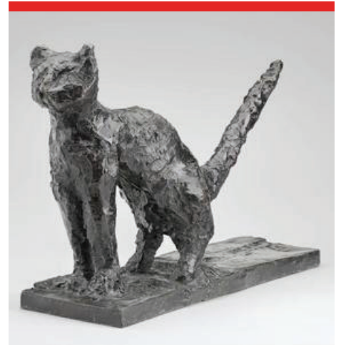
الشكل رقم 8

بيكاسو القط، سنة 1943 منحوتة من البرونز الأبعاد: 36 سم × 18 سم × 55.5 سم