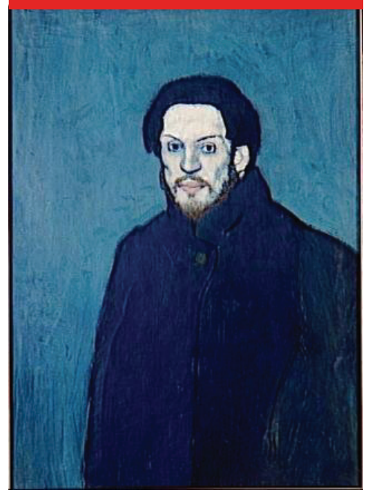
الشكل رقم 3

بيكاسو لوحة ذاتية (بورتريه ذاتي)، سنة 1901 ألوان زيتية على قماش الأبعاد: 80 سم × 60 سم