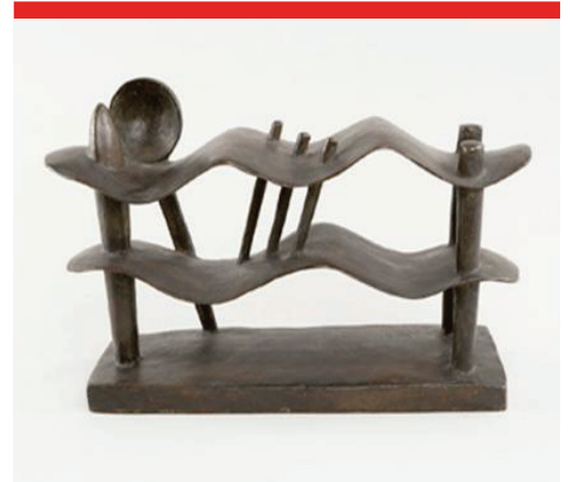
الشكل رقم 11

جياكوميتي الرجل الماشي، سنة 1960 منحوتة من الجبس الأبعاد: 149 سم × 22 سم × 33 سم