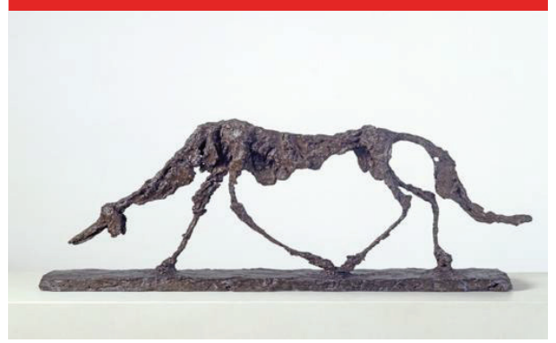
الشكل رقم 5

جياكوميتي الكلب، سنة 1951 منحوتة من البرونز الأبعاد: 46 سم × 98.5 سم × 15 سم