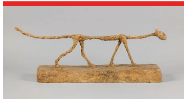
الشكل رقم 7

جياكوميتي امرأة ممددة وحالمة، سنة 1929 منحوتة من البرونز الأبعاد: 23.70 سم × 42.60 سم × 13.60 سم