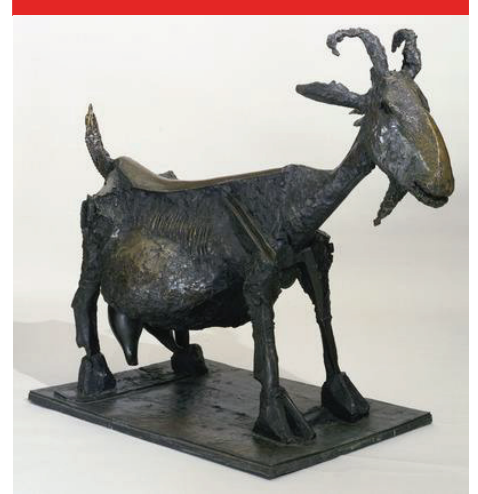
الشكل رقم 6

جياكوميتي الكلب، سنة 1951 منحوتة من البرونز الأبعاد: 46 سم × 98.5 سم × 15 سم