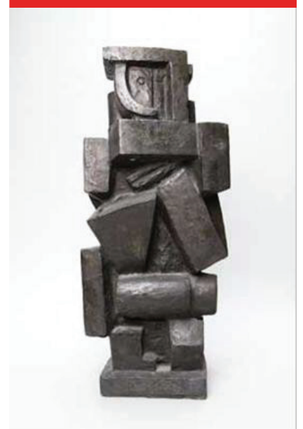
الشكل رقم 13

جياكوميتي شكل تكعيبي، سنة 1926 منحوتة من البرونز الأبعاد: 63.30 سم × 27.60 سم × 27.80 سم