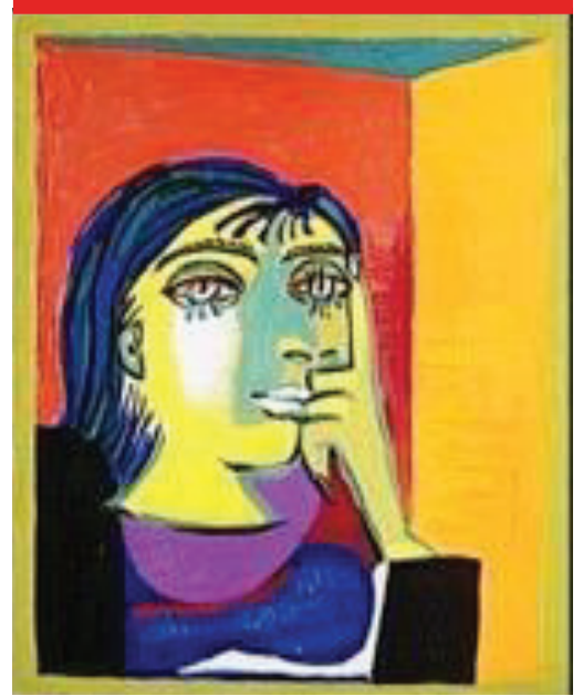
الشكل رقم 1

بيكاسو لوحة دورا مار، سنة 1937 ألوان زيتية على قماش الأبعاد: 55.30 سم × 46.30 سم