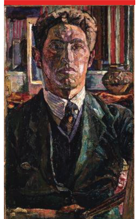
الشكل رقم 4

بيكاسو لوحة ذاتية (بورتريه ذاتي)، سنة 1901 ألوان زيتية على قماش الأبعاد: 80 سم × 60 سم