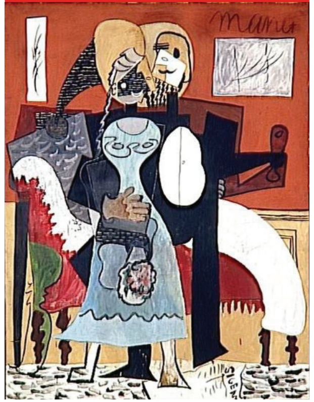
الشكل رقم 10

بيكاسو لوحة العاشقان، سنة 1919 لوحة زيتية على قماش الأبعاد: 185 سم × 140 سم