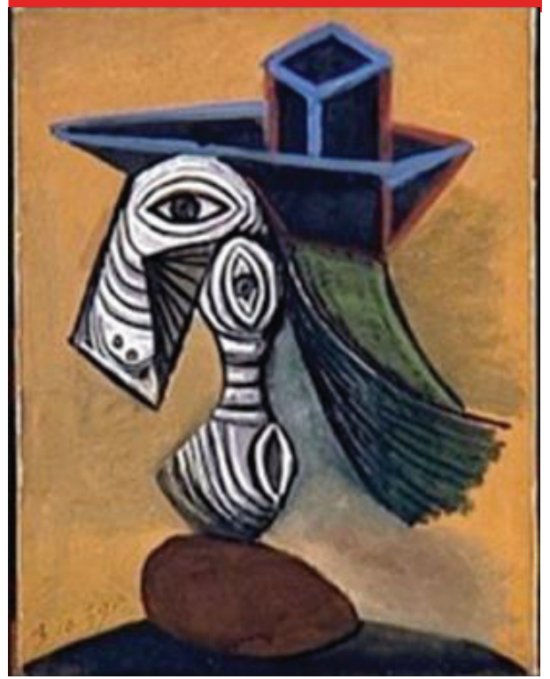
الشكل رقم 12

بيكاسو لوحة المرأة ذات القبعة الزرقاء، سنة 1939 لوحة زيتية على قماش الأبعاد: 65.50 سم × 50 سم